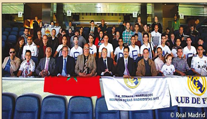
(La Peña Remate de Tetouan à la tribune officielle du Real Madrid)