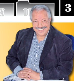
Propos recueillis par le Dr Abdelhak BAKHAT

« La région Tanger-Tétouan-Al Hoceima un modèle et une fierté nationale »